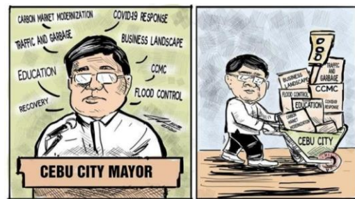
Figyur 3. Showing vs. telling (posted July 2020) on Sunstar’s website.