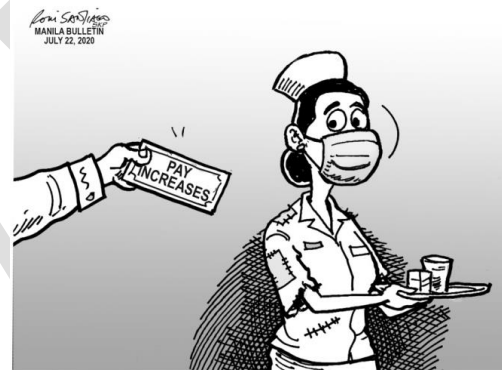
Figyur 2. Government nurse finally get nurses long-delayed pay increase (posted July 2020) on Manila Bulletin’s website.