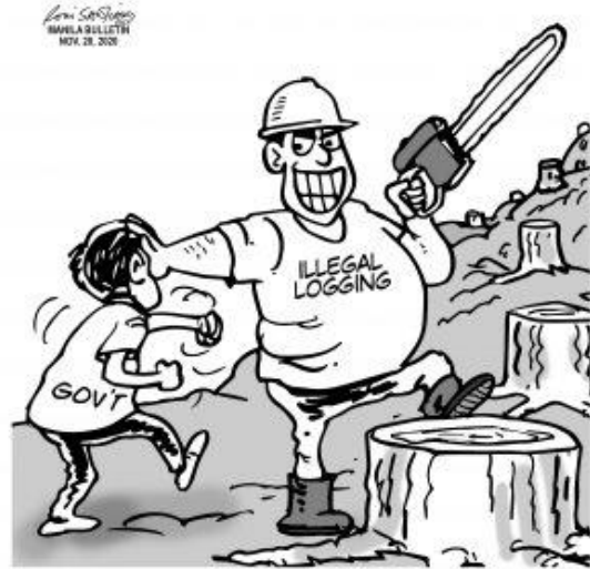
Figur 5. Long-range answer to massive flooding (posted November 2020) on Manila Bulletin’s website (Copyright 2024 Manila Bulletin the Nation’s Leading Newspaper. All rights reserved).